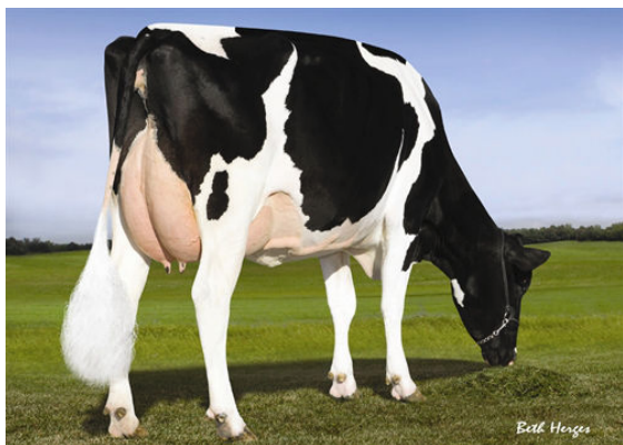
PINE-TREE 2149ROBST 4846 THIRD DAM