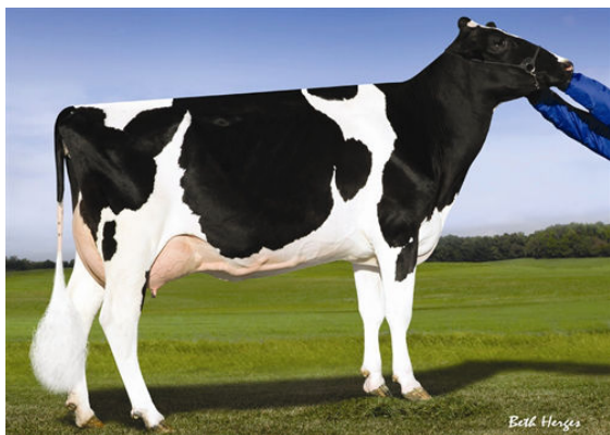
PINE-TREE 2149ROBST 4846 THIRD DAM