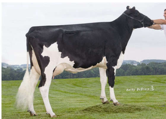
PINE-TREE ZENITH SHEEN FOURTH DAM